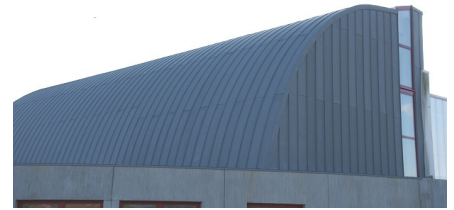
SALLE D'ESCALADE BACS A JOINT DEBOUT QUARTZ-ZINC®

Le saviez-vous? conformément aux prescriptions du DTU 40-41 la couverture zinc sera posée sur du voligeage bois (sapin, épicéa, pin sylvestre, peuplier) compatible; dans le cas contraire, il sera nécessaire d'interposer une membrane.